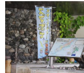
<伊平屋村ポートターミナル>