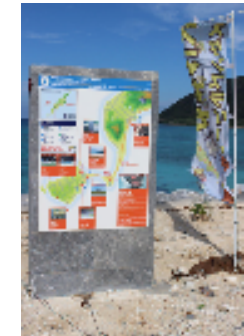
<愛ランドよねざき>